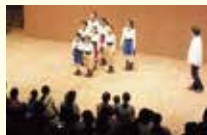
モーツァルト作曲 「魔笛」 (2012年)