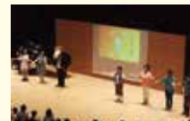
松井和彦作曲 「羊飼いと狼」 (2016年)