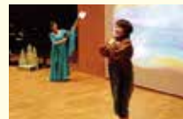
松井和彦作曲 「北風と太陽」 (2015年)