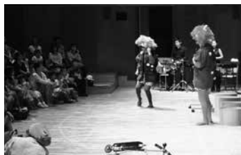
2014年「泣いた赤鬼」より