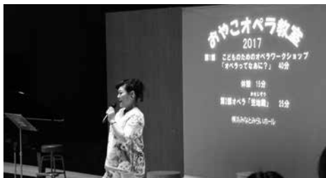
オペラって何かな？わかりやすく解説します。 みんなのぎもんにもお答えしますよ。

オペラって何だろう？歌ってお芝居をすること？ オペラのことを学んだり、歌の練習をしたりします。