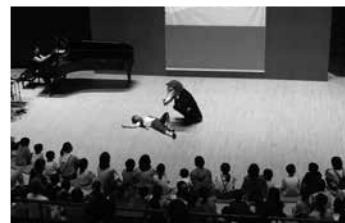
2016年「羊飼いと狼」より