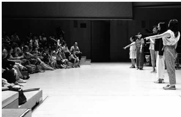
大ホールのステージが客席になるよ！出演者ととても近くでワークショップ。 体を動かしながら声を出してみよう。