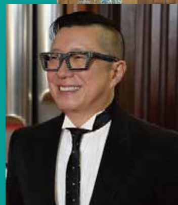
平中弓弦 (オルガン)