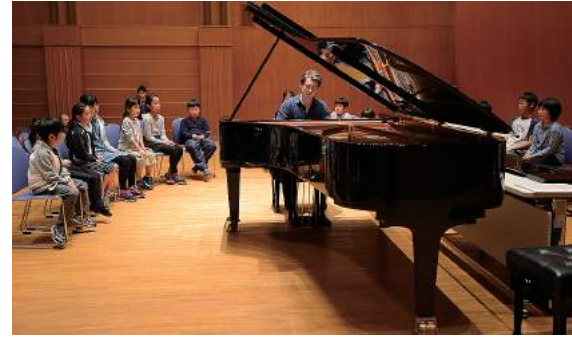
青年のイベント風景より