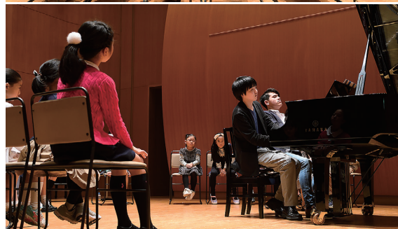
昨年のイベント風景より