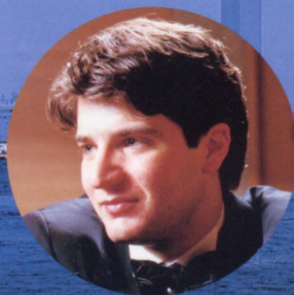
アレッシオ・バックス (イタリア/第14回、1995年) Alessio Bax, Italy