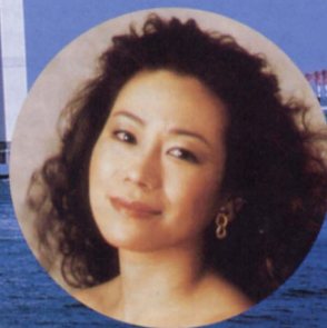
小山実稚恵 (日本/第2回、1983年) Michie Koyama, Japan